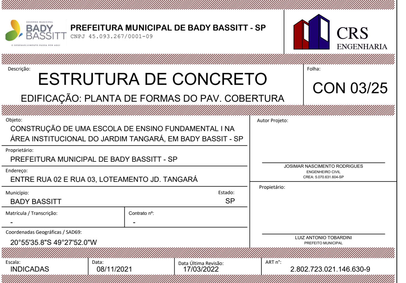
FORMA DO PAVIMENTO COBERTURA (NÍVEL 381) escala 1:100